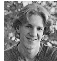
Dylan Klebold (Columbine)